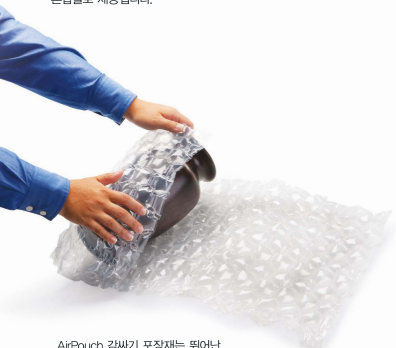
AirPouch 감싸기 포장재는 뛰어난 밀봉성과 내구성을 제공합니다.