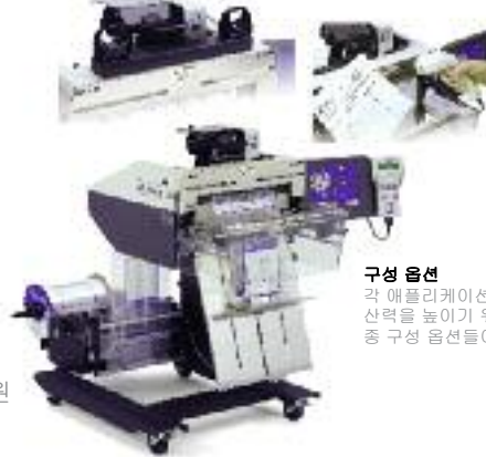
구성 옵션 각 애플리케이션에서 생산력을 높이기 위한 각종 구성 옵션들이 있음